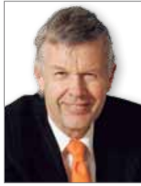
Patriarch baut auf das Know-how von Top-Fondsmanager Jens Ehrhardt.

das durch die Investoren anvertraute Kapital im Portfolio. Fällt der Tageskurs unter die 200-Tage-Linie – unter Beachtung einer dreiprozentigen Toleranz, um Fehlsignale zu vermeiden –, dann wird sofort und automatisch das komplette Portfolio verkauft und das Kapital in klassischen Geldmarktfonds geparkt. Steigt der Tageskurs wieder über die 200-Tage-Linie – ebenfalls unter Berücksichtigung der 3-Prozent-Toleranz – wird sofort wieder in die Portfolios reinvestiert. „Mit dieser Timing-Komponente schafft man es, von Tagesschwankungen abgesehen, wesentliche Kursverluste zu vermeiden und rechtzeitig an den positiven Aufwärtsphasen zu partizipieren“, sagt Fischer. „Die Absicherung funktioniert emotionslos über einen seit über 100 Jahren bewährten Indikator