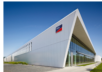
Bei SMA Solar laufen die Geschäfte wieder besser.

Seit der Aufnahme in den Patriarch Classic TSI Fonds hat die Aktie von SMA Solar bereits über 46 Prozent zugelegt und zählt damit zu den Top-Performern im Fonds. Gute Nachrichten am Fließband haben den Aufwärtstrend der Aktie kontinuierlich verstärkt. Erst die Partnerschaft mit dem DAX-Konzern Siemens, dann eine höhere Prognose für das laufende Geschäftsjahr und zuletzt ein Großauftrag aus Großbritannien. Durch die klare TSI-Strategie setzt der Fonds frühzeitig auf solche Werte und profitiert von diesen starken Trends. Auch in Zukunft wird der Patriarch Classic TSI Fonds so weiter auf der Gewinnerstraße bleiben.