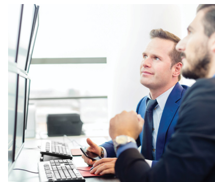
Die Analysten sehen noch Potenzial für die Drillisch-Aktie.

Die US-Investmentbank Goldman Sachs hat das Kursziel für Drillisch nach Zahlen zum zweiten Quartal von 46 auf 48 Euro angehoben und die Einstufung auf „Buy“ belassen. „Die Kennziffern des Mobilfunkproviders sind stark ausgefallen“, schrieb Analyst Abhilash Mohapatra in seiner jüngsten Studie. Deshalb hat er seine längerfristigen Prognosen (2017 bis 2019) für Umsatz und operatives Ergebnis (EBITDA) um durchschnittlich neun beziehungsweise acht Prozent erhöht. Die Drillisch-Aktie ist auch im Portfolio des Dividende 4 Plus Fonds vertreten und notiert über 70 Prozent im Plus.