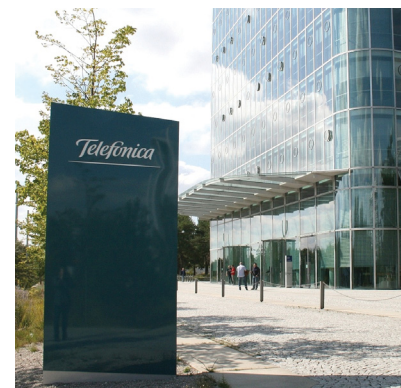
Die Geschäfte bei Telefónica Deutschland laufen hervorragend.

Die Aktie von Telefónica Deutschland hat sich zuletzt stark gezeigt. Diese positive Entwicklung sieht auch die Privatbank Citigroup. Analyst Simon Weeden hat in einer aktuellen Studie seine Kaufempfehlung bestätigt und sieht den fairen Wert des Titels bei 6,20 Euro. Seit Jahresbeginn hätten sich die europäischen Telekomaktien überdurchschnittlich entwickelt, so der Experte. Es gebe auch zukünftig nur wenig Risiken für die weitere Ertragsentwicklung und wegen zahlreicher technologischer Neuerungen dürfte sich auch das organische Wachstum fortsetzen. Die Aktie bleibt wichtiger Bestandteil des Fonds.