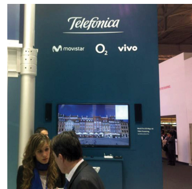
Telefónica Deutschland ist einer der Gewinner am Mobilfunkmarkt.

Nach Einschätzung der französischen Investmentbank BNP Paribas dürfte der deutsche Mobilfunkmarkt im gesamteuropäischen Kontext künftig weiter an Attraktivität gewinnen. Einer der Profiteure hiervon ist Telefónica Deutschland. Die Aktie wird daher als Outperformer des Gesamtmarkts gesehen und es wurde ein Kursziel von 6,20 Euro ausgeben. Nachdem die Holding im zweiten Quartal mit einem positiven Zahlenwerk überraschte, dürften Synergien aus diversen langfristig geförderten Integrations- und Transformationsprojekten auf lange Sicht weitere Ergebnisverbesserungen bewirken.