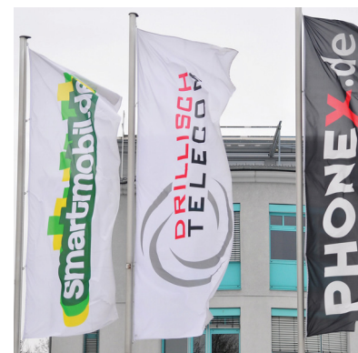
Die Geschäfte von Drillisch laufen hervorragend.