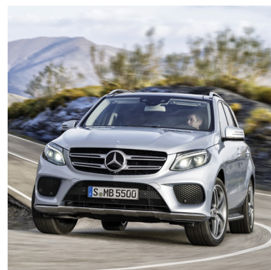
Die Autos mit dem Stern sind beliebt – das sollte für steigende Kurse sorgen.