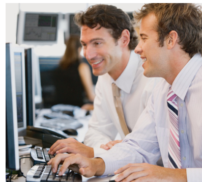
Die Analysten sind optimistisch für die weitere Entwicklung der Drillisch-Aktie.

Die britische Investmentbank Barclays hat die Einstufung für Drillisch auf „Overweight“ mit einem Kursziel von 60 Euro belassen. Das dritte Quartal dürfte seine positive Einschätzung unterstreichen, schrieb Analyst Maurice Patrick in seiner Branchenstudie vor den Quartalsberichten europäischer Telekomkonzerne. Der Mobilfunker dürfte aus eigener Kraft weiter stark gewachsen sein. Die Zahlen werden allerdings erst am 12. November präsentiert. Die Drillisch-Aktie ist auch im Dividende 4 Plus vertreten und notiert bereits deutlich im Plus. Zudem überzeugt die hohe Dividendenrendite, die aktuell bei knapp vier Prozent liegt.