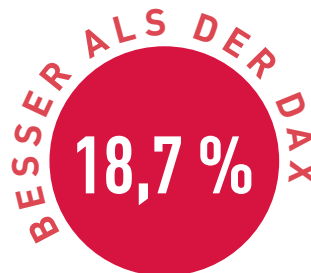
Vergleich in Prozent