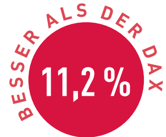
Vergleich in Prozent

nahmen erreicht ist. Für den TSI-Fonds stellt sich diese Frage erst gar nicht, der Aufwärtstrend bei Amazon ist intakt. Das gilt auch für die weiteren Top-Performer im Portfolio wie SMA Solar.