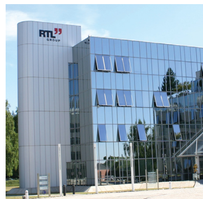
RTL Television hob ein zweites Mal die Umsatzprognose an.

Der Medienkonzern RTL Television hat in dieser Woche ein weiteres Mal seine Prognosen angehoben. Aufgrund des guten Geschäfts im dritten Quartal werde beim Umsatz nun ein moderater Anstieg erwartet, wie das Unternehmen mitteilte. Erst im Sommer hatte das Medienunternehmen seine Erwartungen von stagnierenden Erlösen auf ein leichtes Umsatzplus nach oben korrigiert. Die Prognose für das EBITDA wurde bestätigt. Die Aktie notierte nach der Meldung klar im Plus. Das RTL-Papier ist auch im Dividende 4 Plus Fonds vertreten und hat aktuell eine Gewichtung von zwei Prozent.