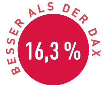
Vergleich in Prozent

reich ihres Jahreshochs. Mit diesen Aktien ist der TSI-Fonds zudem bestens für eine mögliche Jahresendrallye aufgestellt. Neue Höchstkurse sind daher nur eine Frage der Zeit.