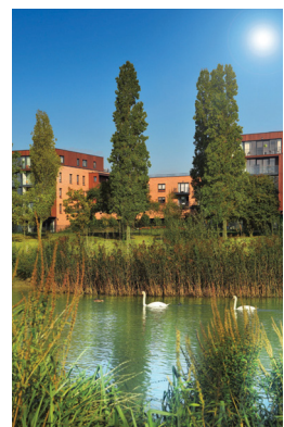
Der Immobilienmarkt läuft gut, die Dividende steigt.

Die Aktie des Londoner Wohnungsbauerunternehmens Berkeley wurde vor fünf Wochen in den Dividende 4 Plus Fonds aufgenommen und zeigte seitdem eine starke Performance. Alleine in der letzten Woche legte der Kurs um über 15 Prozent zu. Der Grund für den Zuwachs waren starke Zahlen und eine Ankündigung des Vorstands Rob Perrins, die Dividende zu erhöhen. Demnach soll das ursprüngliche Programm, das bis 2021 eine Dividende von 13 Britischen Pfund pro Aktie vorgesehen hat, auf 16,34 Pfund pro Anteilsschein erhöht werden soll. Zugleich bekräftigte Berkeley die Ziele für das laufende Jahr.