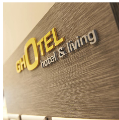
Mit GHOTEL wurden langfristige Mietverträge abgeschlossen.

Aurelius wird in München zwei Hotelimmobilien verkaufen. Das Unternehmen hatte die Gebäude 2011 von der Deutschen Annington übernommen. Für die nun veräußerten Häuser wurden im Rahmen des Verkaufs langfristige Mietverträge mit GHOTEL hotel & living abgeschlossen. Die Verkäufe werden zu einem positiven Ergebnisbeitrag im deutlich zweistelligen Millionenbereich führen. Daran sollen die Aktionäre durch eine Partizipationsdividende beteiligt werden, wie der Konzern mitteilte. Auch die Aurelius-Aktie befindet sich im Fonds und liegt aktuell 52 Prozent vorne.