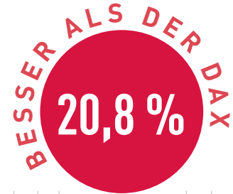
Vergleich in Prozent

Solar-Subventionen in den USA. Auch die Amazon-Aktie sieht charttechnisch hervorragend aus. Gelingt der Ausbruch über das alte Allzeithoch, sollte sich der Aufwärtstrend fortsetzen.