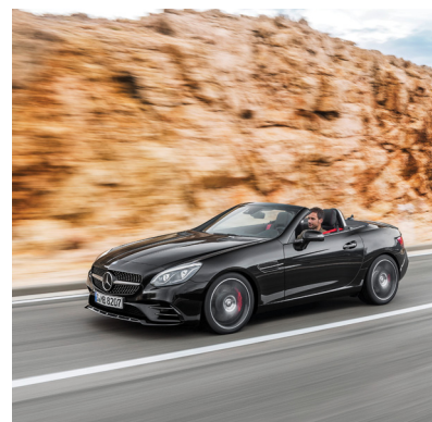
Die Daimler-Aktie hat wieder in die Spur zurückgefunden.

Die Daimler-Aktie hat in dieser Woche wieder deutlich Fahrt aufgenommen. Der Titel konnte den kurzfristigen Abwärtstrend überwinden und legte seit dem Zwischentief über acht Prozent zu. Einer der Kurstreiber war ein Analystenkommentar von Goldman Sachs. Die US-amerikanische Investmentbank rät weiterhin zum Kauf und erhöhte das Kursziel für die Daimler-Aktie auf 87 Euro. Das Wachstum des weltweiten Autoabsatzes dürfte sich 2016 beschleunigen, schrieb Analyst Stefan Burgstaller. Die Daimler-Aktie ist auch im Fonds vertreten und notiert derzeit 16 Prozent im Plus.