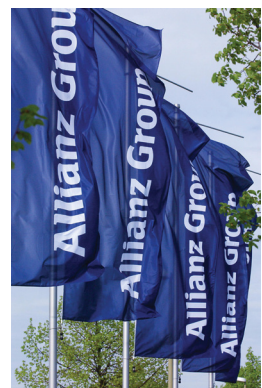
Allianz-Anleger können sich 2017 wohl über eine Sonderdividende freuen.

Bei der Allianz wird es 2016 spannend. Tätigt der Versicherungs-Riese wie schon 2014 und 2015 auch im kommenden Jahr keine größeren Zukäufe, so wird das für Akquisitionen zurückgestellte Kapital 2017 an die Anteilseigner in Form einer Sonderdividende ausgeschüttet. Dann dürfte die ohnehin schon stattliche Dividendenrendite von mehr als vier Prozent wohl in den hohen einstelligen Prozentbereich klettern. Indes konnte der Kurs an den letzten Handelstagen des Börsenjahres 2015 noch einmal zulegen. Die Allianz-Aktie befindet sich auch im Dividende 4 Plus Fonds und liegt klar vorne.