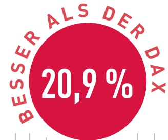
Vergleich in Prozent

tes auf dem Niveau des Jahreshochs. Von dieser Relativen Stärke profitiert der TSI-Fonds und wird damit auch in Zukunft eine deutliche Überrendite generieren.