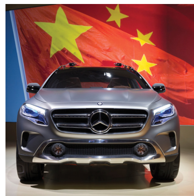
Die Autos mit dem Stern sind in China äußerst beliebt.

Die Baader Bank bestätigte die Einstufung für Daimler nach Absatzzahlen für den chinesischen Markt auf „Buy“ mit einem Kursziel von 113 Euro. Im Vergleich zum Vorjahr sind im Dezember rund 19 Prozent mehr neue Pkws registriert worden, was laut Analyst Klaus Breitenbach vor allem einer niedrigeren Steuer geschuldet sei. Mit 1,99 Millionen verkauften Autos stellte der Stuttgarter Hersteller 2015 einen neuen Verkaufsrekord auf. Für Daimler ist China mittlerweile der wichtigste Absatzmarkt – noch vor den USA. Die DAX-Aktie überzeugt mit einer Dividendenrendite von fast vier Prozent und ist im Portfolio des Dividende-4-Plus-Fonds vertreten.