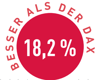
Vergleich in Prozent

Von dieser Erholungsbewegung der Märkte kann auch der Patriarch Classic TSI Fonds profitieren. Zu den Top-Positionen des Fonds zählen Werte wie Adidas oder Wirecard, die nach wie vor im Bereich des Jahreshochs notieren. Positive Nachrichten sorgten bei beiden Werten für Rückenwind. Während die Präsentation eines neuen Großkunden der Aktie des Bezahl dienstleistungsanbieters Aufschwung verliehen hatte, wurde bei Adidas die Bekanntgabe des Nachfolgers des scheidenden Vorstandsvorsitzenden Hainer als positiv gewertet. Die Nachfolge tritt Kaspar Rorsted an, der aktuell noch Vorstandschef des DAX-Konzerns Henkel ist.