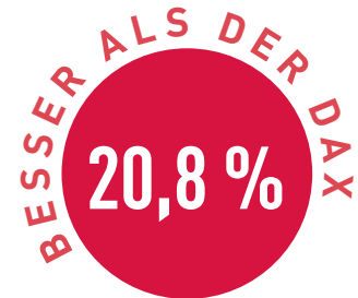
Vergleich in Prozent

mance als der Gesamtmarkt aufzuweisen. Warum sonst sollte man auch in einen Fonds investieren? Verfolgen Sie hierzu gerne die Renditeentwicklung in der Vergangenheit und der Zukunft.