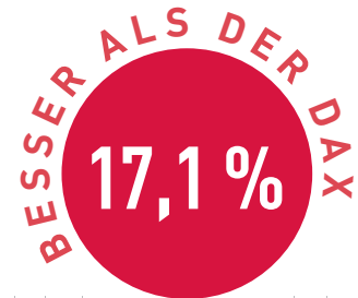
Vergleich in Prozent

nachdem in den letzten Wochen „nur“ eine parallele Entwicklung erreicht wurde. Dieser Umbau ist weiter in vollem Gange. Weitere Informationen hierzu finden Sie auf www.tsi-fonds.de .