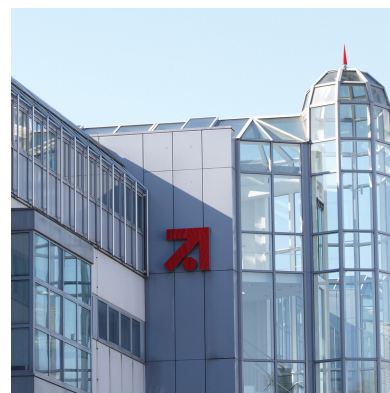
Die Geschäfte von ProSiebenSat.1 laufen hervorragend.

Einer der Top-Werte des Dividende 4 Plus hat in der vergangenen Woche starke Geschäftszahlen gemeldet. ProSiebenSat.1 befindet sich weiter auf Erfolgskurs und hat das Jahr 2015 mit Rekordwerten abgeschlossen. Der Konzern steigerte seinen Umsatz um 13,4 Prozent auf 3,3 Milliarden Euro. Der bereinigte Konzernüberschuss wuchs mit einem Plus von 11,6 Prozent auf 467,5 Millionen Euro erneut deutlich. Von seinen starken Zahlen will der Konzern auch seine Aktionäre profitieren lassen. ProSiebenSat.1 will daher seine Dividende um 12,5 Prozent auf 1,80 Euro steigern. Dies entspricht einer Dividendenrendite von weit über drei Prozent.