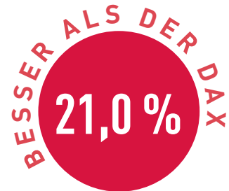
Vergleich in Prozent

Cashquote hochfährt, um einen „Puffereffekt“ gegenüber starken Gesamtmarktkorrekturen zu erzeugen. Aktuell liegt die Cashquote bei 12,5 Prozent.