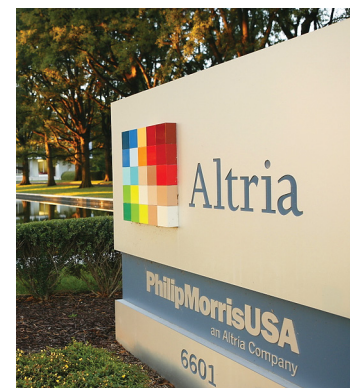
Die Tabak-Aktie Altria ist ein Dauerbrenner im Portfolio.

Wie Rauch steigt der Kurs von Altria unweigerlich nach oben. Aktuell notiert der Wert des US-Tabakkonzerns im Bereich des Allzeithochs. Das Unternehmen ist nicht nur bekannt für seine Marken wie Marlboro oder L&M, sondern auch für seine hervorragende Dividendenpolitik. Breits seit dem Jahr 1928 beteiligt Altria seine Anleger an den Gewinnen und seit 1969 hat der Konzern seine Dividende ununterbrochen angehoben. Diese starke Historie ist auch für den Patriarch Classic Dividende 4 Plus ein absolutes Qualitätskriterium. Daher ist die Aktie ein fester Bestandteil des Fonds.