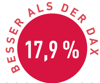
Vergleich in Prozent

Auch bei den Turbulenzen an den Märkten hält sich der Trend-Fonds weiter stabil besser als der DAX.