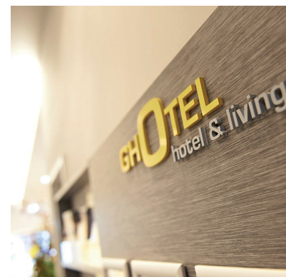
Die GHOTEL-Gruppe ist eine Beteiligung, die mit zum Erfolg von Aurelius beigetragen hat.

Aurelius ist seit Mitte Februar im Rallyemodus. Der Top-Wert aus dem Dividende-4-Plus-Fonds hat zuletzt mit positiven Nachrichten geglänczt. Anfang März verkündete Aurelius, dass man im vergangenen Jahr erstmals in der Firmengeschichte die Umsatzmarke von zwei Milliarden Euro übertreffen konnte. Gleichzeitig erreichte der operative Gewinn (EBITDA) ebenfalls einen Rekordwert von über 123 Millionen Euro. Der Konzern lässt seine Anleger mit einer soliden Dividende von knapp vier Prozent an den Gewinnen teilhaben. Der Wert bleibt eine feste Größe im Dividende-4-Plus-Fonds.