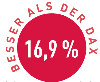
Vergleich in Prozent

aufgenommen. Seitdem hat der Wert seine Trendstärke weiter ausgeprägt und zuletzt ein neues Allzeithoch erreicht. Mittlerweile zählt Adidas zu den Top-Performern im TSI-Fonds.