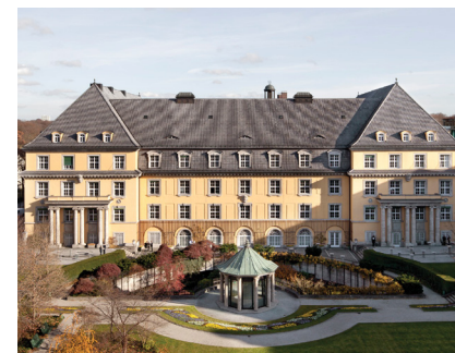
Bei der Munich Re laufen die Geschäfte hervorragend.