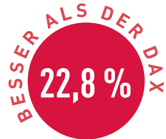
Vergleich in Prozent

anteile und das Fondsmanagement setzt die vom TSI-System gegebenen Anlagevorschläge in die Tat um – Emotionen und nervöses Hin-und-her-Handeln bleiben so völlig aus dem Spiel.