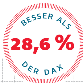
Performance in Prozent