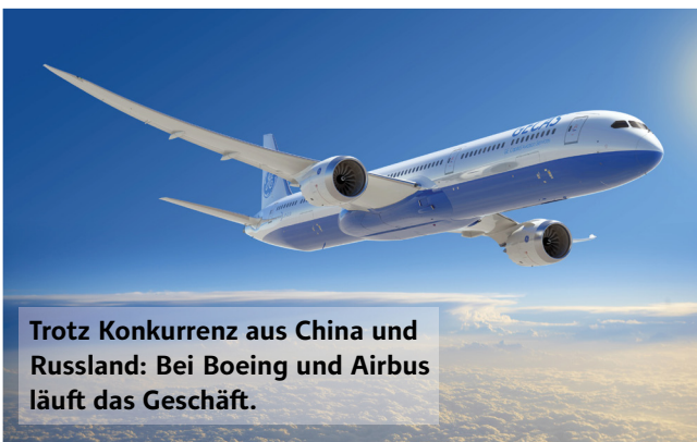
Trotz Konkurrenz aus China und Russland: Bei Boeing und Airbus läuft das Geschäft.

Mit dem Mittelstreckenflieger M-21 will Russland den marktdominierenden Flugzeugbauern Boeing und Airbus Marktanteile abjagen und die Abhängigkeit vom westlichen Duopol lösen. Ebenfalls in den Flugzeugmarkt einsteigen wollen die Chinesen mit ihrer C919. Dem Hersteller Comac liegen bereits 570 Aufträge von 23 Kunden vor. Airbus setzt aktuell mit seiner Tochter Airbus Helicopters viel daran, sein Engagement in China voranzutreiben. Im chinesischen Qingdao erfolgte der erste Spatenstich für eine Endmontagelinie für den Mehrzweckhubschrauber H135. Die Airbus-Tochter gilt mit einem Marktanteil von 47 Prozent als weltweit führend auf dem zivilen sowie halbstaatlichen Markt für Helikopter.