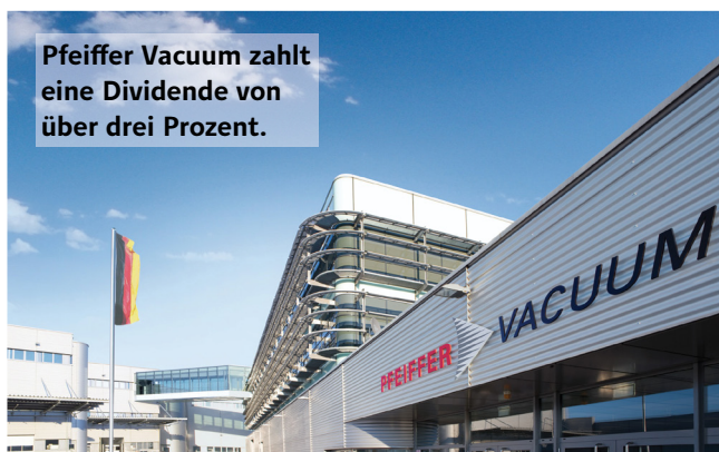
Pfeiffer Vacuum zahlt eine Dividende von über drei Prozent.

Der im TecDAX notierte Vakuumpumpenhersteller Pfeiffer Vacuum legte kürzlich die Daten für das zweite Quartal vor. Der Umsatz stieg deutlich um 23 Prozent auf fast 140 Millionen Euro. Das Ergebnis vor Zinsen und Steuern legte jedoch lediglich um 3,6 Prozent auf 14,6 Millionen Euro zu. Belastet hatte dabei vor allem die Übernahme des US-Unternehmens Nor-Cal. Die hohen Kosten waren jedoch ein Einmaleffekt. In Zukunft dürfte sich laut der Vorstandsetage von Pfeiffer Vacuum der Zukauf positiv auf die weitere Geschäftsentwicklung auswirken. Die Aktie befindet sich bereits seit geraumer Zeit im Depot. Derzeit überzeugt die Aktie zudem mit einer Dividendenrendite von knapp über drei Prozent.