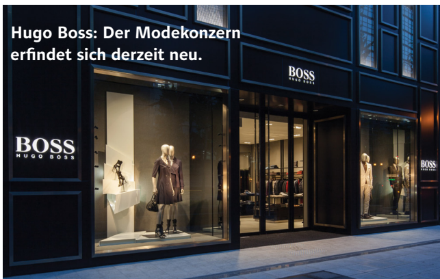
Hugo Boss: Der Modekonzern erfindet sich derzeit neu.

Der Modekonzern Hugo Boss konnte vor allem dank guter Geschäfte in Europa seinen Umsatz im zweiten Quartal des laufenden Jahres im Vergleich zum Vorjahr um drei Prozent auf 653 Millionen Euro steigern. Das Konzernergebnis fiel mit 54 Millionen Euro sieben Prozent schwächer aus als im Vergleichszeitraum. Vorstandschef Mark Langer sieht den Modekonzern jedoch weiter auf Kurs. Zuletzt befand sich das Unternehmen aus dem Baden-Württembergischen Metzingen auf einem Restrukturierungskurs. Etliche Läden wurden geschlossen, der Ausflug in das Luxussegment beendet und die Preise gesenkt. Auf dem aktuellen Kursniveau liegt die Dividendenrendite der Aktie bei fast vier Prozent.