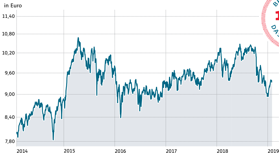
Chartverlauf inkl. aller ausgezahlten Ausschüttungen