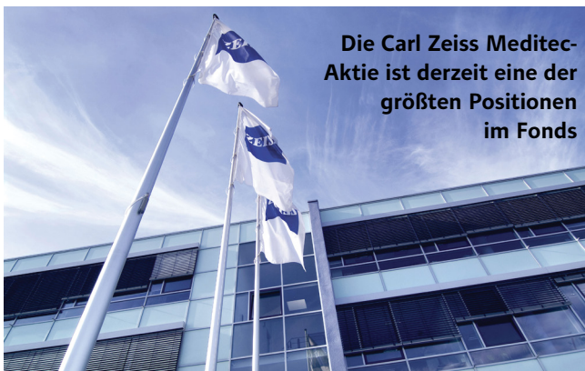
Die Carl Zeiss Meditec-Aktie ist derzeit eine der größten Positionen im Fonds

Zu den Schwergewichten aus Deutschland im Dividende 4 Plus Fonds zählt Carl Zeiss Meditec. Die Aktie macht derzeit 2,9 Prozent des Gesamtportfolios aus. Der Buchgewinn seit Kauf liegt bei rund 30 Prozent. Nach einer Schwächephase haben zuletzt die Bullen wieder das Steuer übernommen. Der langfristige Aufwärtstrend war jedoch zu keiner Zeit gefährdet. Fundamental ist bei dem Medizintechnikkonzern alles im grünen Bereich. Im letzten Jahr wurde mit einem Umsatz von 1,28 Milliarden Euro und einem Gewinn von 126,2 Millionen Euro ein Rekordergebnis verbucht. Für das laufende Jahr erwartet man bei dem Konzern weiteres Wachstum. Die Dividendenrendite liegt auf dem aktuellen Niveau bei knapp einem Prozent.