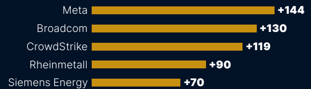
Performance in Prozent