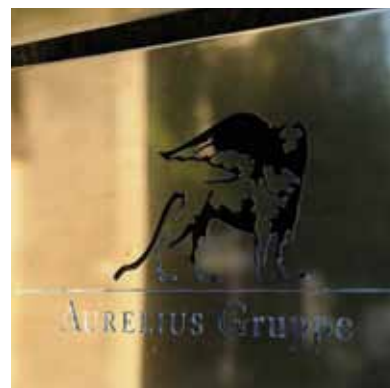
Das Beteiligungsportfolio von Aurelius wächst weiter.