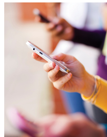
T-Mobile US gewinnt bei Mobilfunkkunden an Beliebtheit.