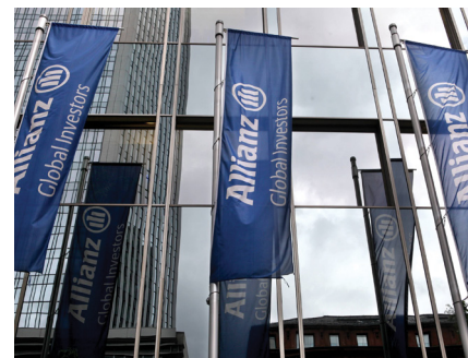
Die Experten sehen noch Kurspotenzial bei der Allianz-Aktie.

Die Allianz zählt mit einer Gewichtung von über drei Prozent zu den größten Positionen im Fonds. Zuletzt hat die Citigroup das Kursziel für die Aktie von 150 auf 157 Euro angehoben und die Einstufung auf „Buy“ belassen. Analyst Farooq Hanif geht in seiner Studie davon aus, dass die Dividende in Zukunft stärker wächst als bisher erwartet, nachdem die Versicherungsunternehmen die Risiken abgebaut haben.