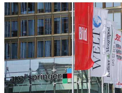
Der Medienkonzern Axel Springer baut sein Beteiligungsportfolio weiter aus.