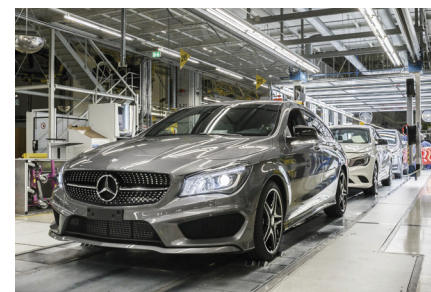
Beim Autobauer Daimler laufen die Geschäfte rund.

Auf Jahressicht legte der Umsatz bei Daimler um 10 Prozent auf 129,9 Milliarden Euro zu. Unter dem Strich stieg der Überschuss leicht auf 6,96 Milliarden. Nach einem überzeugenden Comeback 2014 setzt Daimler-Chef Dieter Zetsche dem Autobauer für die Zukunft hohe Ziele. 2015 will der Konzern Verkaufszahlen, Umsatz und den Gewinn aus dem Kerngeschäft deutlich steigern. Zudem soll die Ertragskraft in den kommenden Jahren auf ein bisher unerreichtes Niveau bei den Stuttgartern steigen. Die Dividende steigt auf 2,45 Euro je Aktie und damit auf ein Rekordniveau. Auch im Dividende-4-Plus-Fonds ist die Daimler-Aktie mit einer Gewichtung von 2,5 Prozent vertreten. Aktuell notiert die Position bereits 20 Prozent im Plus.