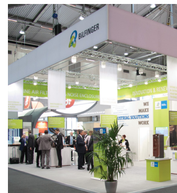
Bilfinger zahlt seinen Anlegern weiterhin eine respektable Dividende.

Der Dienstleistungskonzern Bilfinger ist im vergangenen Jahr erstmals seit 1998 wieder in die Verlustzone gerutscht. Auch die Aussichten für das laufende Jahr sind alles andere als rosig: Leistung und bereinigter Gewinn dürften sinken. Ein Lichtblick ist die erwartete leichte Verbesserung im operativen Geschäft. Die Aktionäre konnte Bilfinger nach dem Kurssturz bis Dezember 2014 mit einer Dividende von 2,00 Euro je Aktie besänftigen. Analysten hatten mit einem noch kräftigeren Einschnitt gerechnet. Dementsprechend konnte die Bilfinger-Aktie in der vergangenen Woche zulegen.