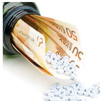
Der Gewinn bei BB Biotech fiel 2014 besser aus, als im Vorfeld erwartet wurde.

Neu im Portfolio des Dividende-4-Plus-Fonds sind die Papiere von BB Biotech. Die jüngsten Zahlen der Schweizer Beteiligungsgesellschaft fielen positiv aus. Der Nettogewinn belief sich im abgelaufenen Geschäftsjahr 2014 auf 1,47 Milliarden Schweizer Franken. Das ist der höchste Gewinn seit der Gründung im Jahre 1993. Experten hatten im Vorfeld nur mit 1,37 Milliarden Schweizer Franken gerechnet. Die Dividende soll gegenüber dem Vorjahr um 65 Prozent auf 11,60 Schweizer Franken angehoben werden. Auf dem aktuellen Kursniveau entspricht dies einer stattlichen Dividendenrendite von fast vier Prozent.