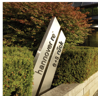
Die Aktionäre von Hannover Rück dürfen sich über eine satte Dividende freuen.