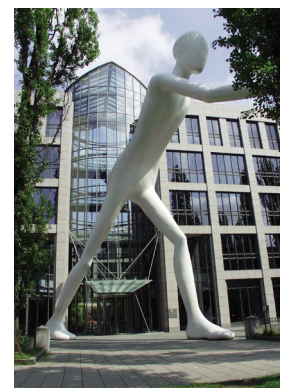
Die Analysten sehen bei der Aktie von Munich Re noch Potenzial.

Die US-Bank JPMorgan hat das Kursziel für Munich Re von 200 auf 220 Euro angehoben und die Einstufung auf „Overweight“ belassen. Analyst Michael Huttner hob in einer Studie seine Prognosen für den Überschuss der Jahre 2015 und 2016 um sechs Prozent an. Zudem glaubt Huttner, dass der Rückversicherer bei den Reserven positiv überraschen wird. Die Aktie von Munich Re ist mit einer Gewichtung von fast vier Prozent einer der größten Positionen im Dividende 4 Plus Fonds und überzeugt mit einer Dividendenrendite von derzeit 3,9 Prozent.