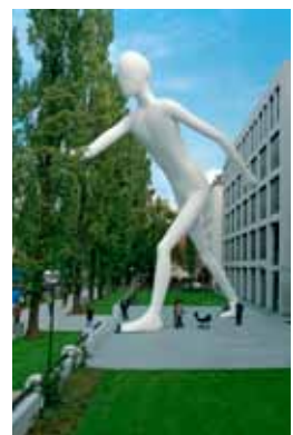
Immer in Bewegung – jetzt zieht auch die Aktie der Munich Re an.

Seit Jahren zählt die Munich RE zu den dividendenstärksten Papieren im DAX. Am 2. Mai ist es wieder so weit. Der Versicherungskonzern wird einen Teil seiner Gewinne an die Aktionäre ausschütten. Pro Aktie werden 7,25 Euro ausgezahlt. Bezogen auf den aktuellen Aktienkurs von 167 Euro entspricht das einer Rendite von 4,3 Prozent. Da nicht nur die Dividendenhöhe, sondern auch die Kontinuität der Auszahlungen beeindruckend ist, ist die Aktie der Munich RE von Beginn an eine der größten Positionen des Dividende-4-Plus-Fonds. Aktuell beläuft sich die Gewichtung auf 4,3 Prozent.