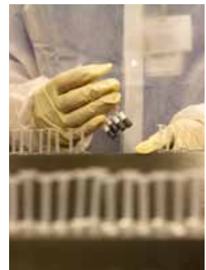
Wann und zu welchem Preis greift sich Pfizer AstraZeneca?

Es bahnt sich eine der größten Übernahmen in der Pharmebranche an und die Anleger des Dividende-4-Plus-Fonds sind mit von der Partie. Denn seit dem 22. April befindet sich die Aktie des Pharmakonzerns AstraZeneca im Portfolio des Fonds. Neben der üppigen Dividendenrendite von fast vier Prozent war die anhaltende Übernahmefantasie ausschlaggebend für den Kauf der Aktie, der sich bereits ordentlich ausgezahlt hat. Durch das mittlerweile schon zwei Mal nachgebesserte Gebot des Aufkäufer Pfizer liegt die Position mit 18 Prozent im Plus.