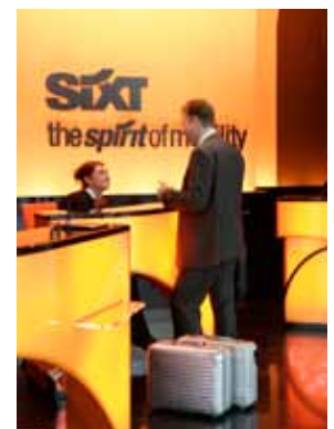
Immer schön freundlich: Das Geschäftsjahr 2014 ist bei Sixt gut angelaufen.

Der deutsche Autovermieter Sixt ist auf dem besten Weg, auch im kommenden Jahr eine hohe Dividende auszahlen zu können. Im ersten Quartal 2014 legte das Ergebnis vor Steuern um 20 Prozent auf 26,6 Millionen Euro zu. Auch für das Gesamtjahr geht Sixt von einem leicht wachsenden Überschuss aus. Insofern ist durchaus mit einer Erhöhung der ohnehin schon üppigen Dividende zu rechnen. Darauf setzt auch der Dividende-4-Plus-Fonds, der die besonders dividendenstarken Vorzugsaktien von Sixt im Bestand hat, deren Rendite bei 4,3 Prozent liegt.