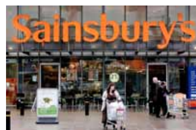
Sainsbury gehört in Großbritannien zum Alltag.

Nur wenige deutsche Anleger werden Aktien von Sainsbury im Depot haben. Dabei lohnt sich gleich in mehrfacher Hinsicht ein Blick auf das Papier der britischen Supermarktkette, die bereits im Jahr 1869 gegründet wurde. Sainsbury beschäftigt 160.000 Mitarbeiter und erwirtschaftet trotz zunehmender Konkurrenz von Discountern fortlaufend Gewinne. Anleger freuen sich seit zehn Jahren über steigende Dividenden, die aktuelle Dividendenrendite liegt bei 5,0 Prozent. Seit der Aufnahme ins Fondsvermögen des Dividende-4-Plus-Fonds hat die Aktie von Sainsbury 4,6 Prozent zugelegt.